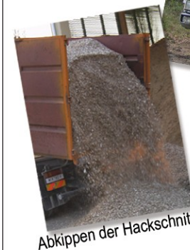
Abkippen der Hackschnitzel