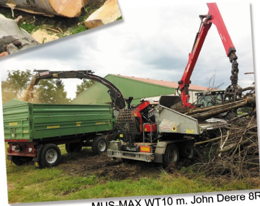
MUS-MAX WT10 m. John Deere 8R