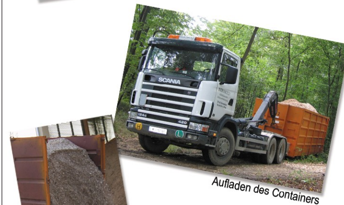
Aufladen des Containers