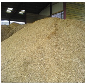
Lagerung der Hackschnitzel in unserer Halle