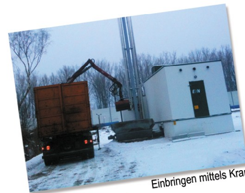
Einbringen mittels Kran

Der Transport des Hackgutes mit unseren modernen Containerfahrzeugen die bis zu 80 m 3 auf einmal verbringen können ist individuell vereinbar.