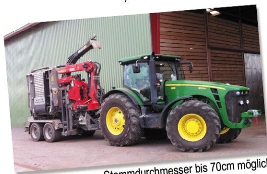
Stammdurchmesser bis 70cm möglich

Mobile Trommelhacksysteme werden zur Pflege von Forst- und Waldbeständen und zur Nutzung der anfallenden Restholzmaterialien zu energiespendenden Qualitätsprodukten eingesetzt.